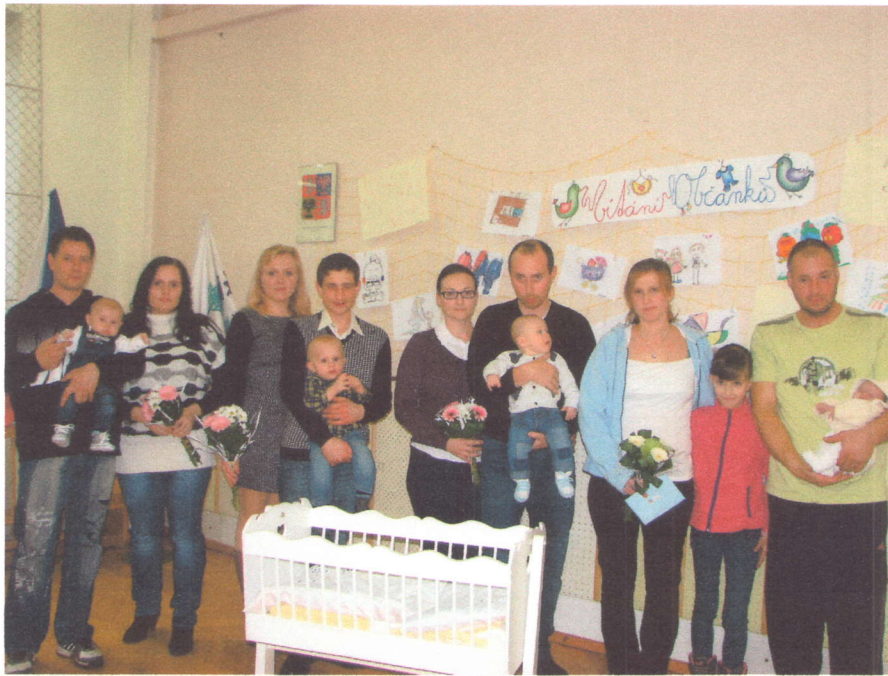
„Vítání krčmaňských občánků 12. prosince 2015“.