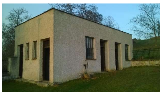
Krčmaňská hřbitovní márnice.