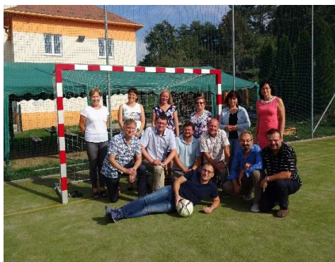
Setkání starostů MK v Krčmani 13. 9. 2018.