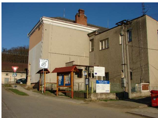
Budova MŠ v Krčmani.