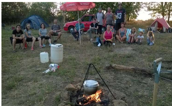
„Retro Pekla 2018“ - pobyt v přírodě pod stany.