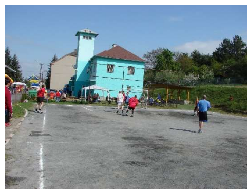
Rekonstrukce multifunkčního hřiště u OÚ.

Krčmaňský zpravodaj: Složení redakční rady: Poznámka redakce: Registrační značka: Obec Krčmaň: Datum: