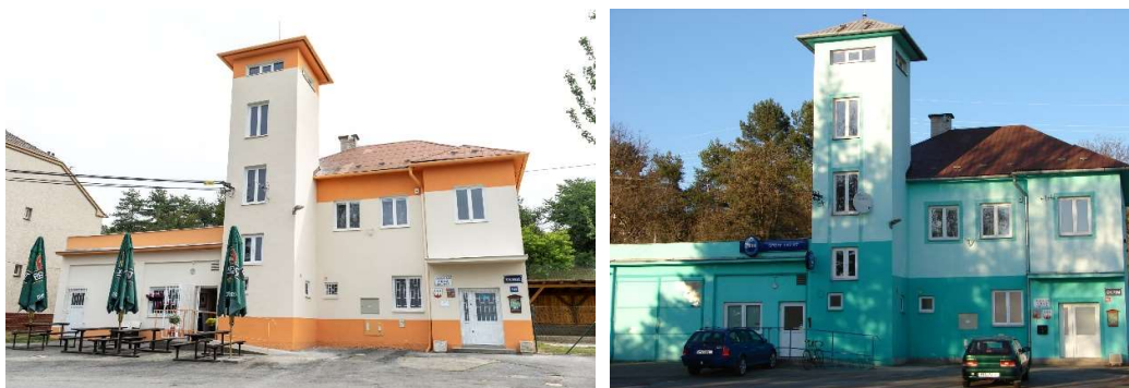
Budova Obecního úřadu v Krčmani.