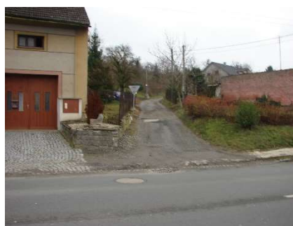
Rekonstrukce místní komunikace Na Stráži.