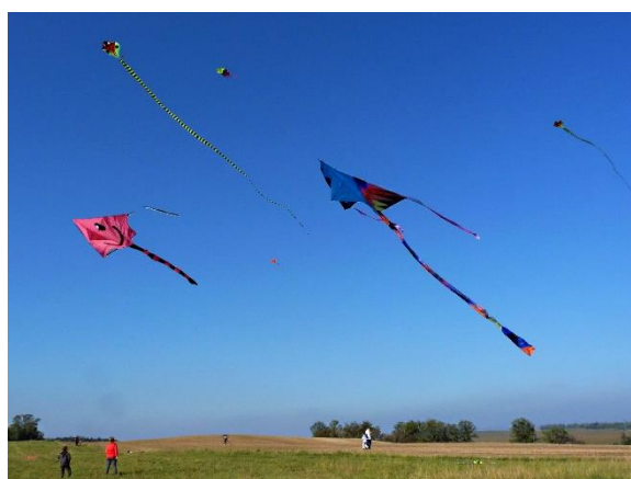
K3 – Běh přes tři vrcholy a pouštění létajících draků. Říjen 2019.