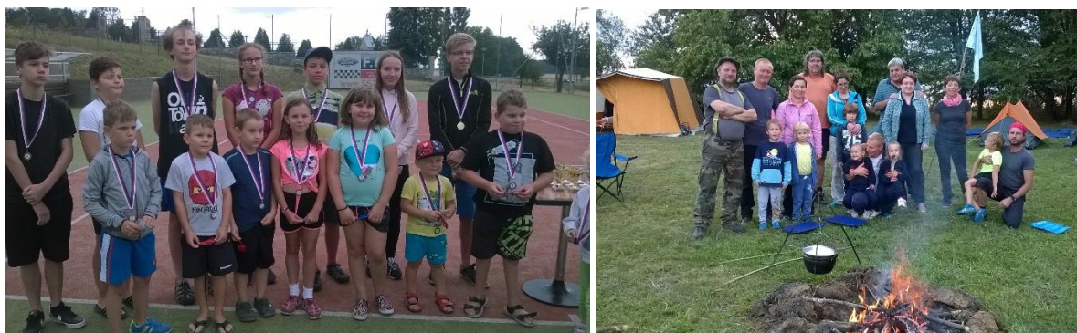
Dětsí účastníci „Křčmaňské prakiády“ a „Retro Pekla 2019“. Prázdniny v obci.