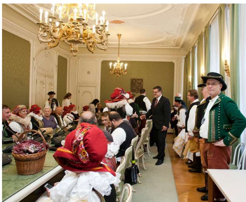
Obr. 3: Hanáci v Senátu ČR.