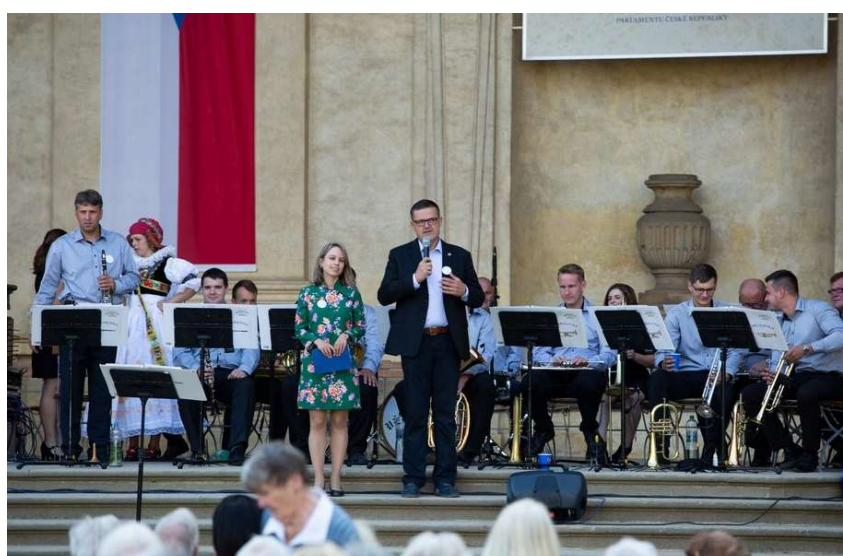
Obr. 4: Věrovanka ve Valdštejnské zahradě.