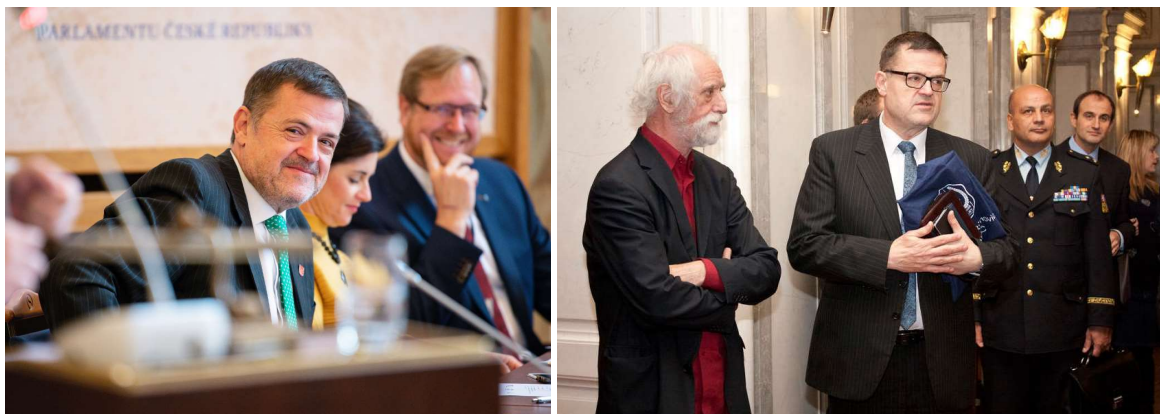
Obr. 1 a 2: Pracovní povinnosti při výkonu funkce senátora.