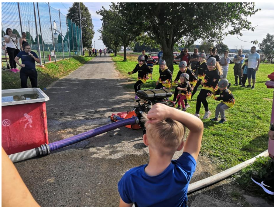
Den obce – mladí hasiči z Grygova v akci