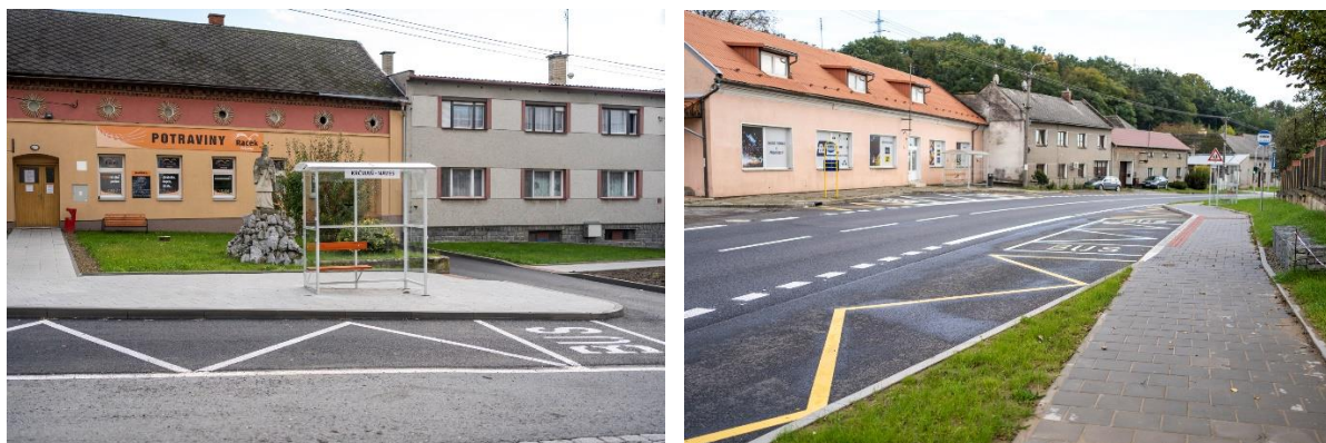
Rekonstrukce chodníků na Návsi a okolo silnice I. třídy.

výše jmenovaného také na nezbytné opravy technické a dopravní infrastruktury jako ochranná opatření před přívalovými dešti. Bohužel nám nebylo vyhověno.